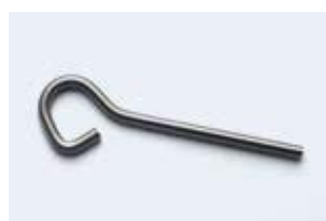
Piton «P» inox de sécurité