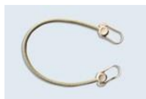
Sandowclick sable de sécurité